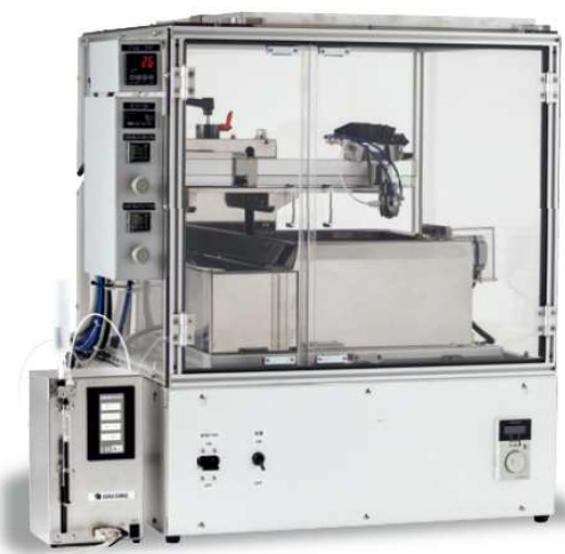
研究実験用コーティング装置 rCoater®

Spray coating equipments for research experiments